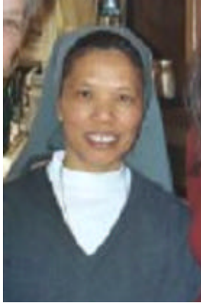
Bernadette Sagma Salesian Sisters,